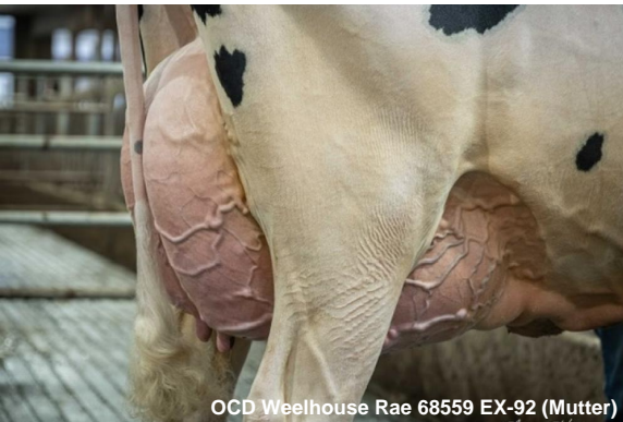
OCD Weelhouse Rae 68559 EX-92 (Mutter)