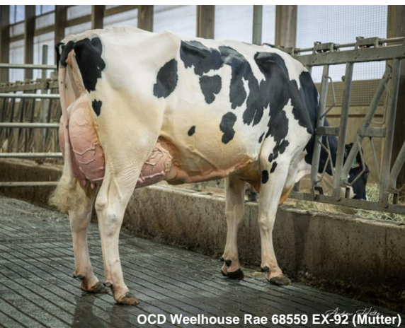
OCD Weelhouse Rae 68559 EX-92 (Mutter)