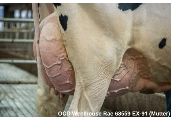
OCD Wheelhouse Rae 68559 EX-91 (Mutter)