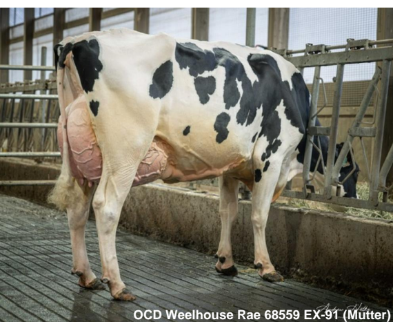
OCD Wheelhouse Rae 68559 EX-91 (Mutter)