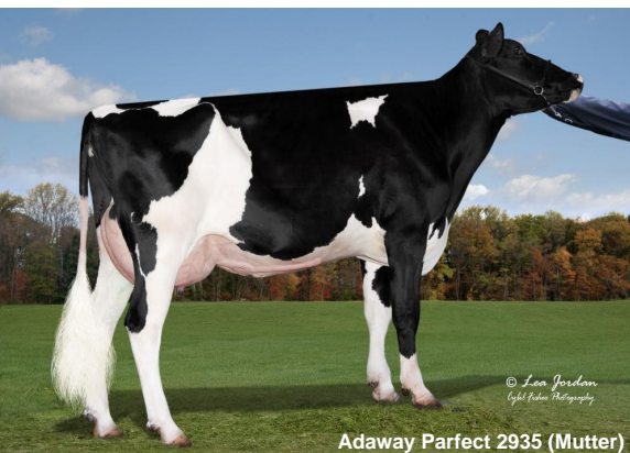
Adaway Parfect 2935 (Mutter)