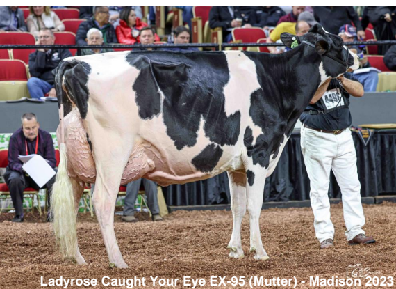
Ladyrose Caught Your Eye EX-95 (Mutter) - Madison 2023