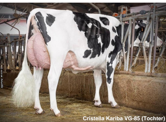
Cristella Kariba VG-85 (Tochter)